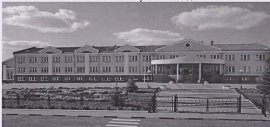
Тишанка, 2023 г.